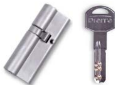
CILINDRO BASIC + 5 LLAVES