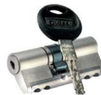
CILINDRO NEWPOWER+ 5 LLAVES (opcional)